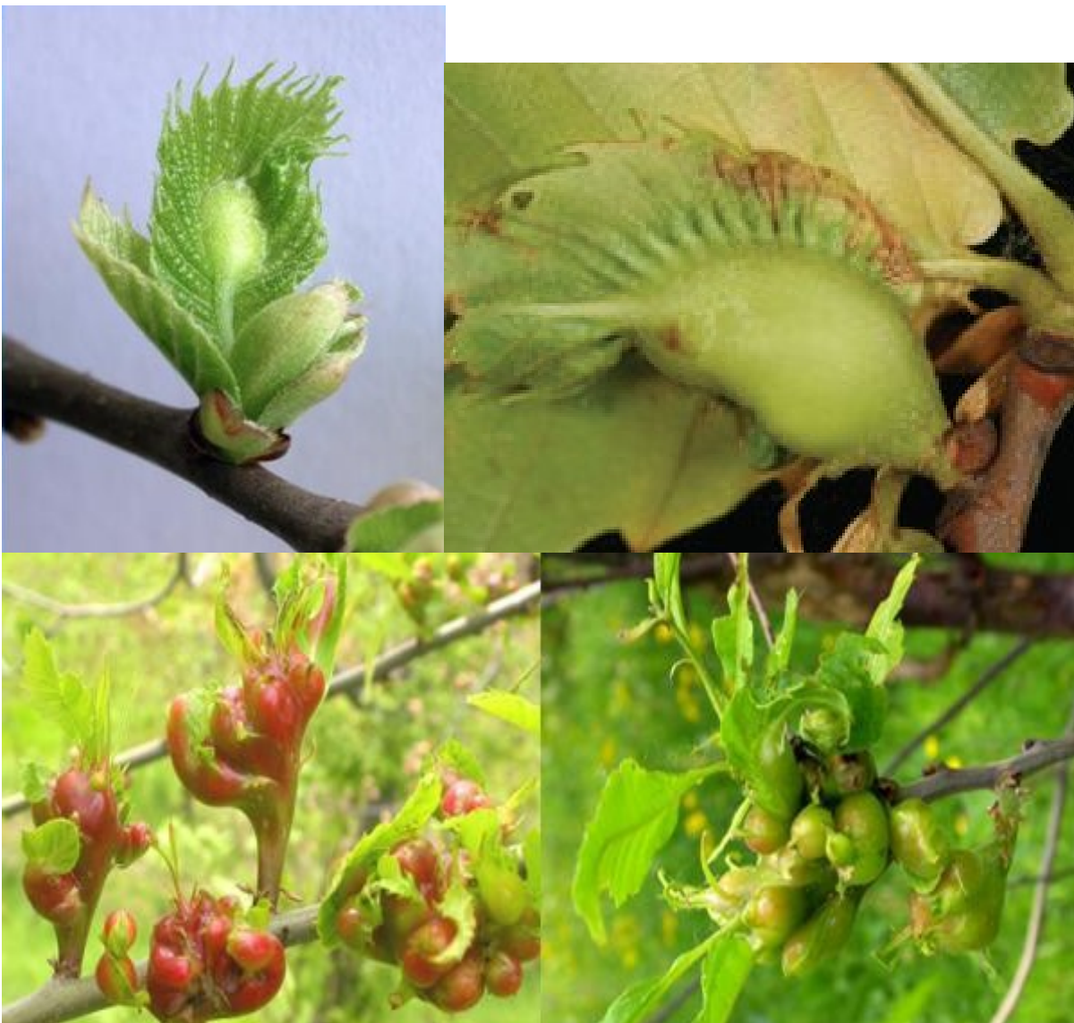
Εικόνα 2: Κηκίδες σε βλαστούς , φύλλα, οφθαλμούς