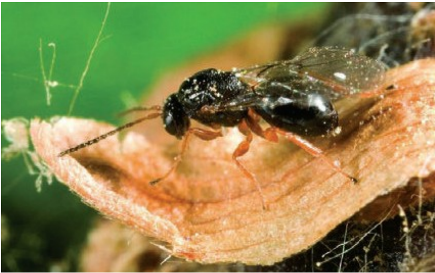
Εικόνα1: Το έντομο Dryocosmus Kuriphilus