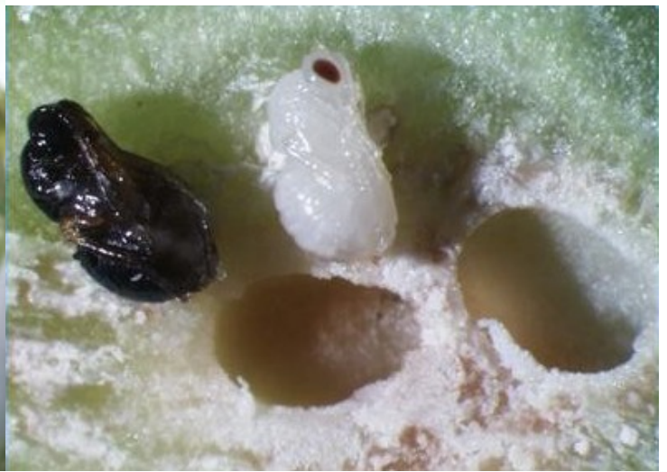
Εικόνα 5: Νύμφες