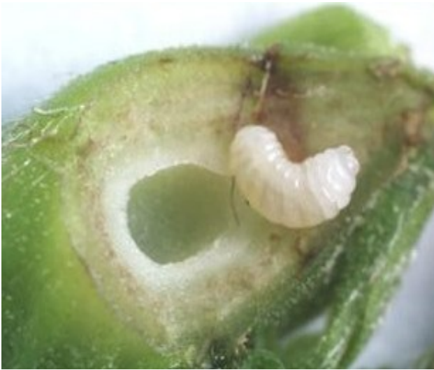
Εικόνα 4: Προνύμφη