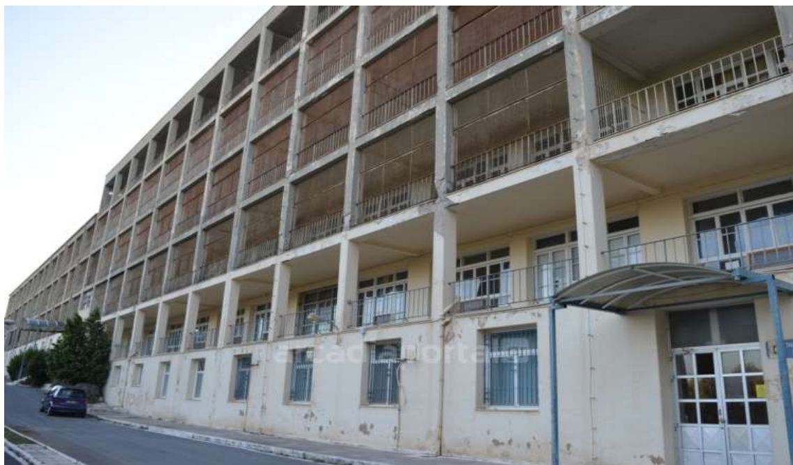
Εικ.1 Κεντρικό Κτίριο