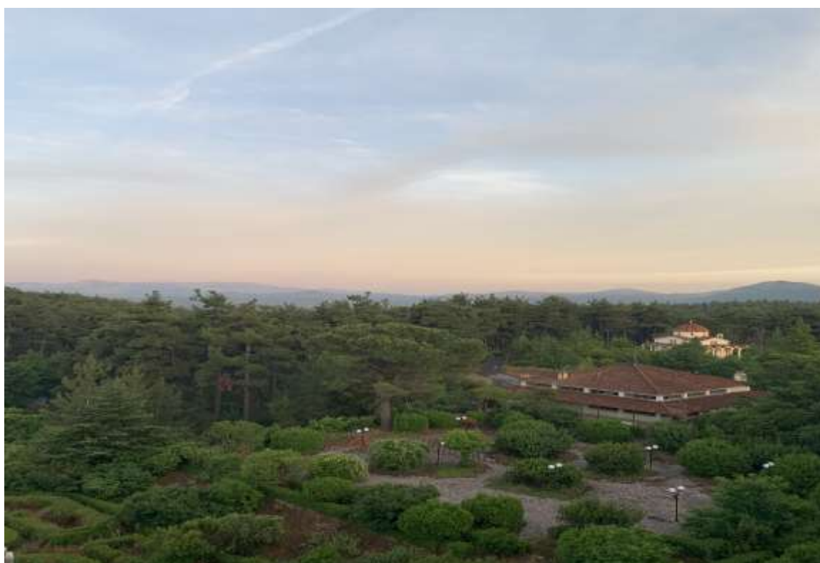
Εικ. 2 Γενική αποψη