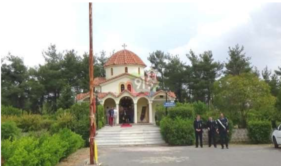
Εικ. 4 Ιερός Ναός Αγ. Σπυρίδωνα