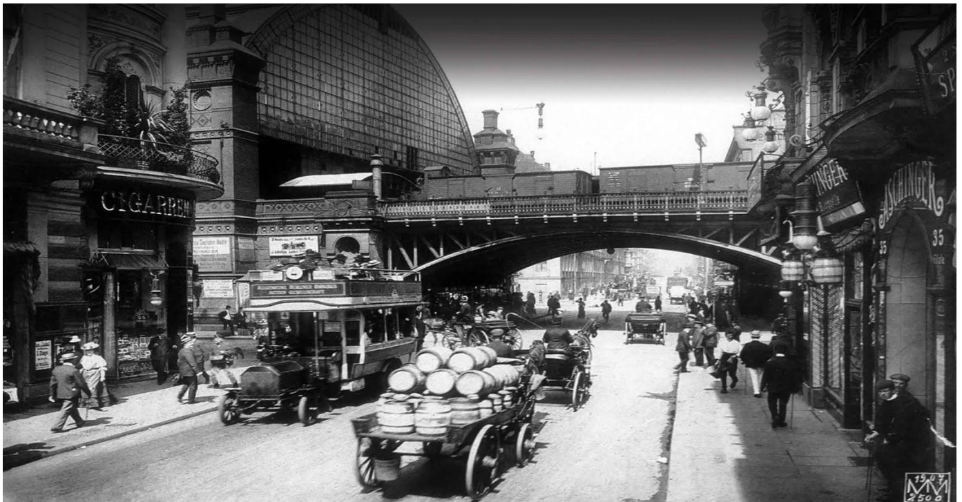
Berlin: Symphony of a Great City

Με αφορμή το φετινό αφιέρωμα του φεστιβάλ που είναι « Πόλεις του Κόσμου » στην τελετή θα προβληθεί η ταινία Βερολίνο: Η Συμφωνία Μιας Μεγαλούπολης (Berlin: Symphony of a Great City) του Walter Ruttmann , ένα διαχρονικό ντοκιμαντέρ του 1927 που περιγράφει τη ζωή στο Βερολίνο την περίοδο του Μεσοπολέμου, μια πόλη εν μέσω βιομηχανικής άνθησης. Την προβολή θα πλαισιώσει με ζωντανή μουσική, ειδικά διασκευασμένη για την ταινία, ο διακεκριμένος συνθέτης, πιανίστας και μουσικολόγος, Μηνάς Αλεξιάδης.