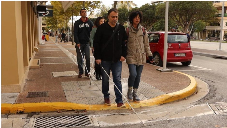
Beyond my Eyes